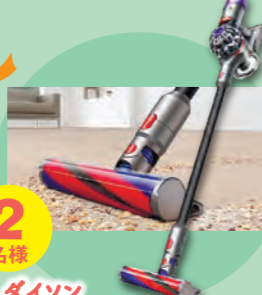
2名様 ダイソン V8 Slim Fluffy Extra