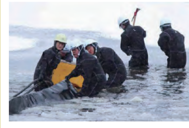
厳冬期における沼からの取水訓練

このほか、運搬道(アクセラート)を確保するためのがれき撤去訓練など、さまざまな訓練を行っています。