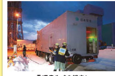
電源喪失時を想定し、電源ケーブルを敷設する訓練