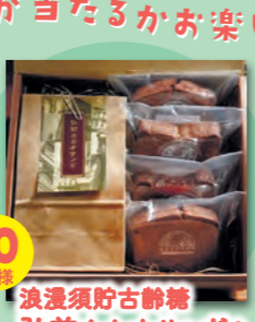
10名様 浪速須磨古御膳 弘前カカオサンド&ケーキセットA