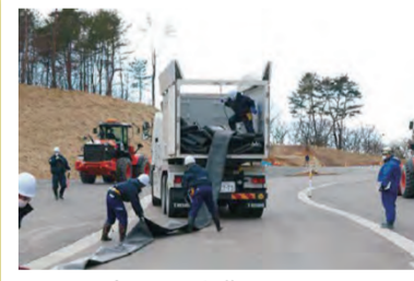
冷却水を移送するためのホース展張訓練