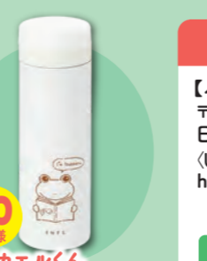
20名様 ツカエルくん ステンレスボトル